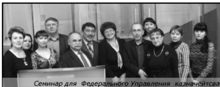
Семинар для Федерального Управления казначейства

«Сначала я сюда попала случайно, так как мне захотелось углубить свои знания в области экономики, как науки. Наш